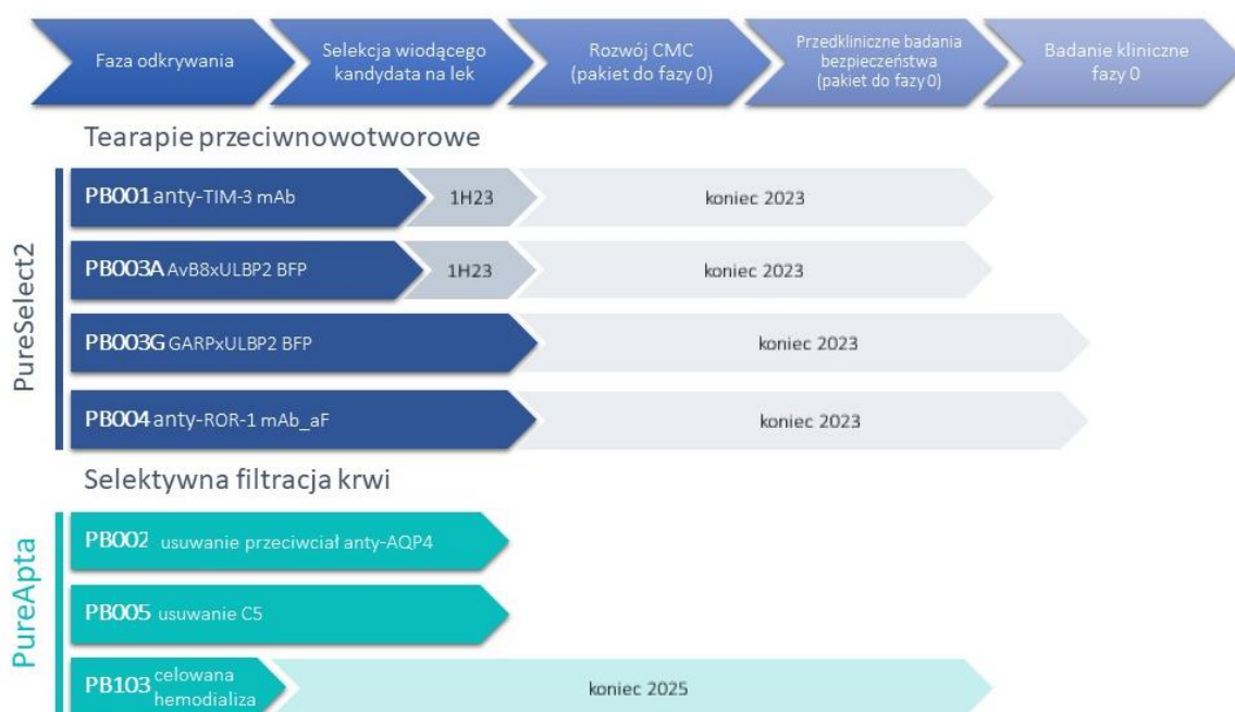
Rys. 2: Stan prac nad projektami w ramach portfolio B+R Pure Biologics S.A.